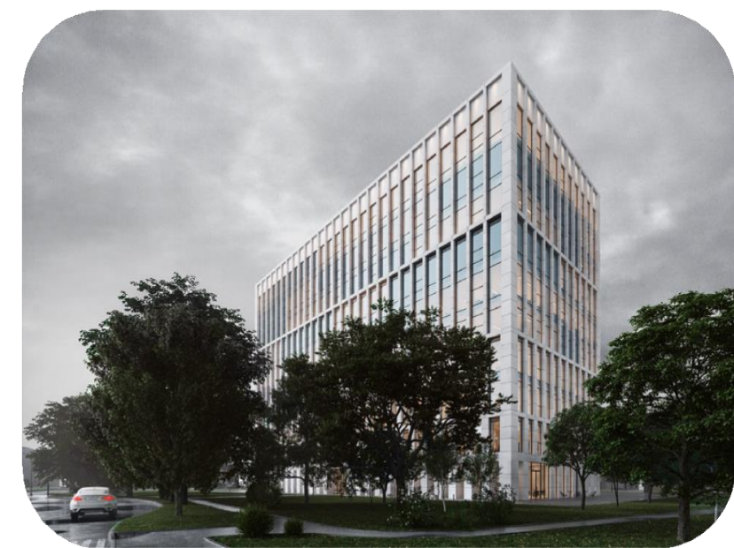
● STONE КУРСКАЯ