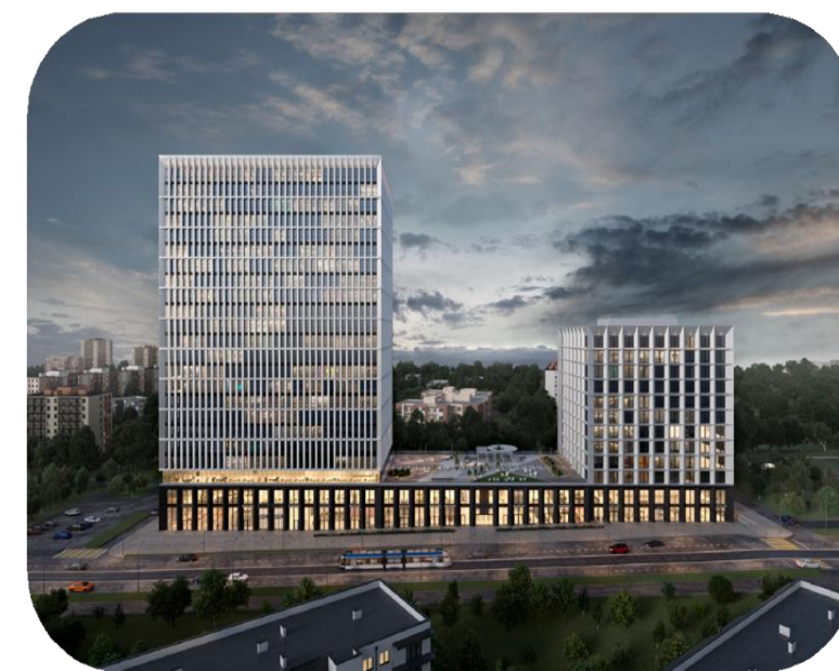
● STONE ЛЕНИНСКИЙ