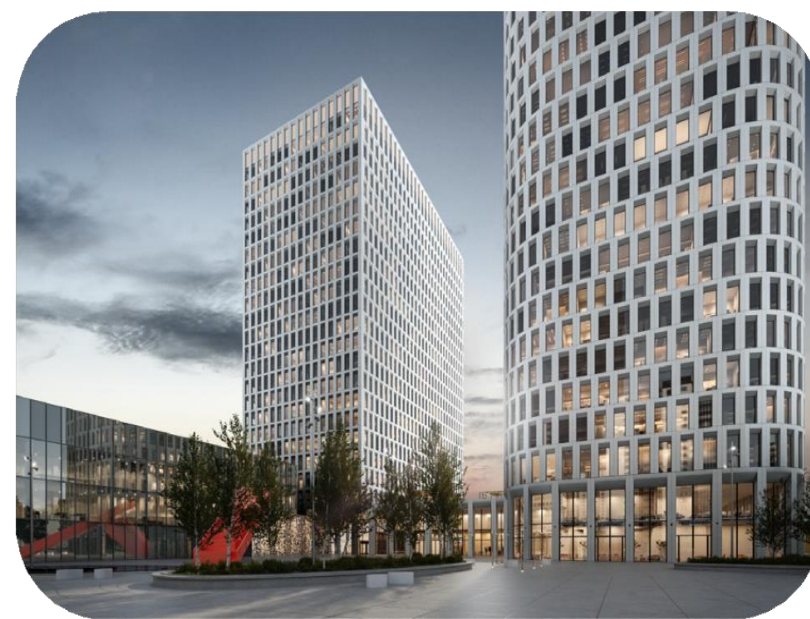
● STONE САВЕЛОВСКАЯ