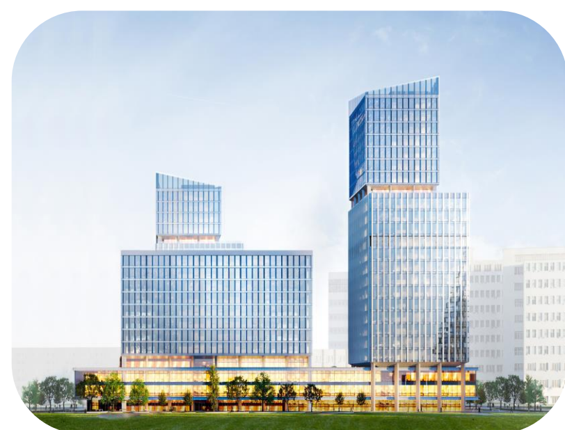
● STONE КАЛУЖСКАЯ