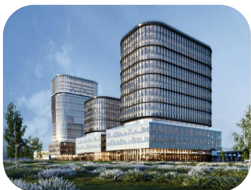
● STONE ХОДЫНКА 2