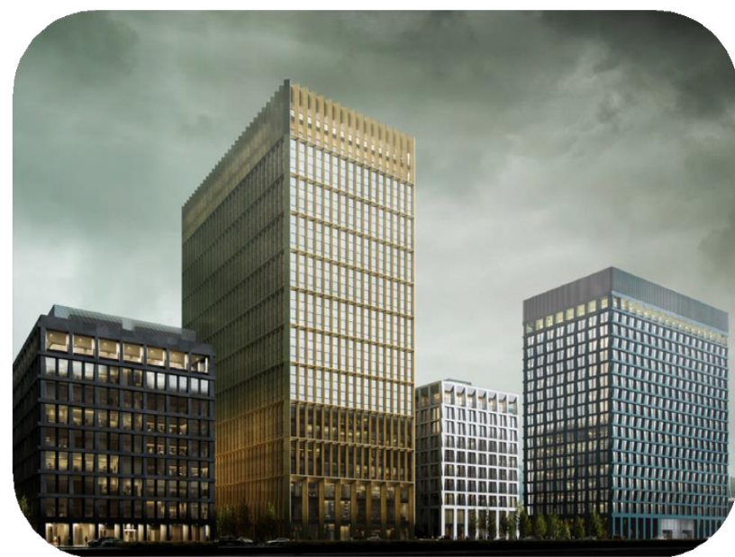
● STONE TOWERS