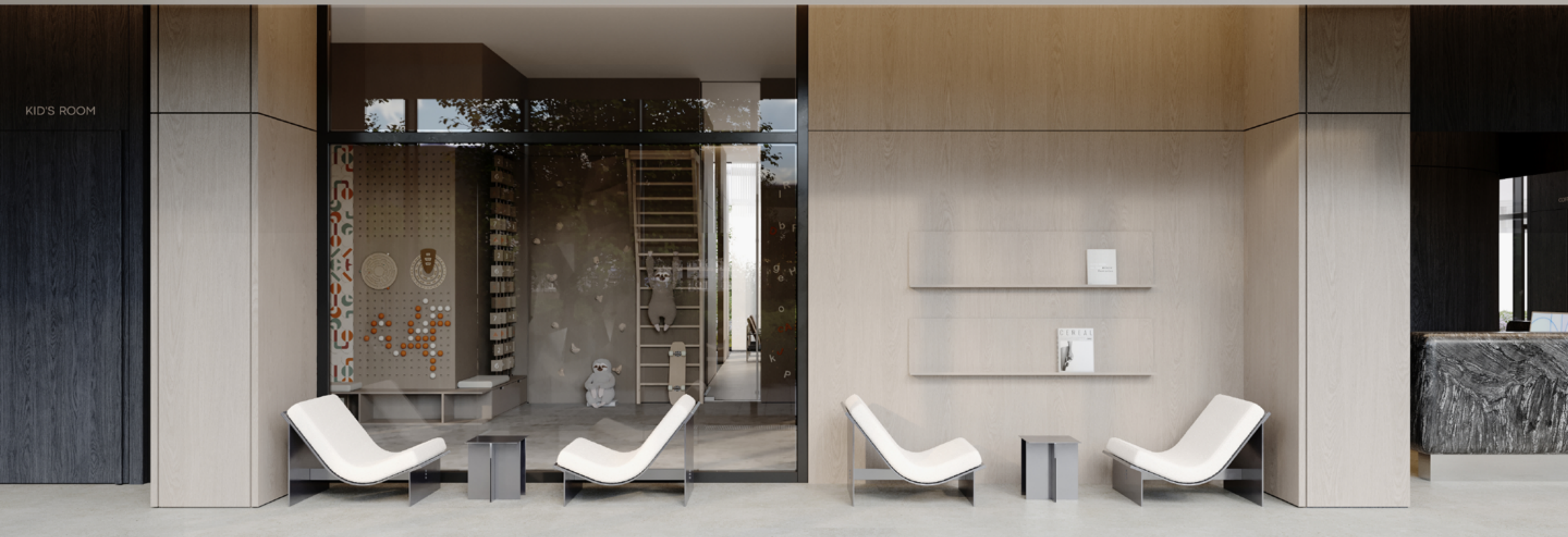
Светлая галерея с видами на внутренний двор