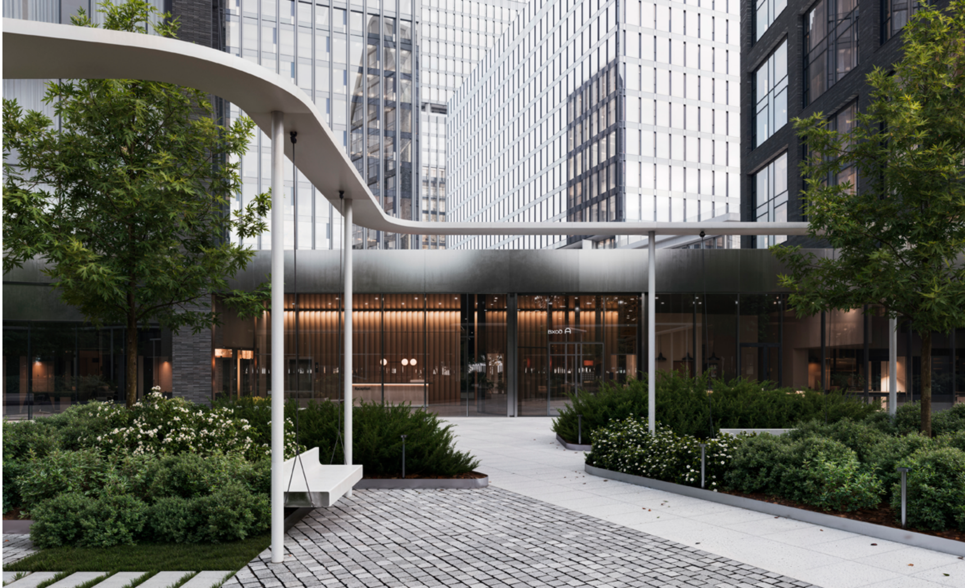
Прогулочная аллея с качелями