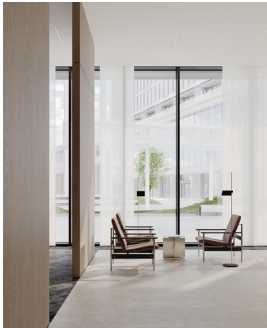
Мягкая зона в бизнес-гостиной