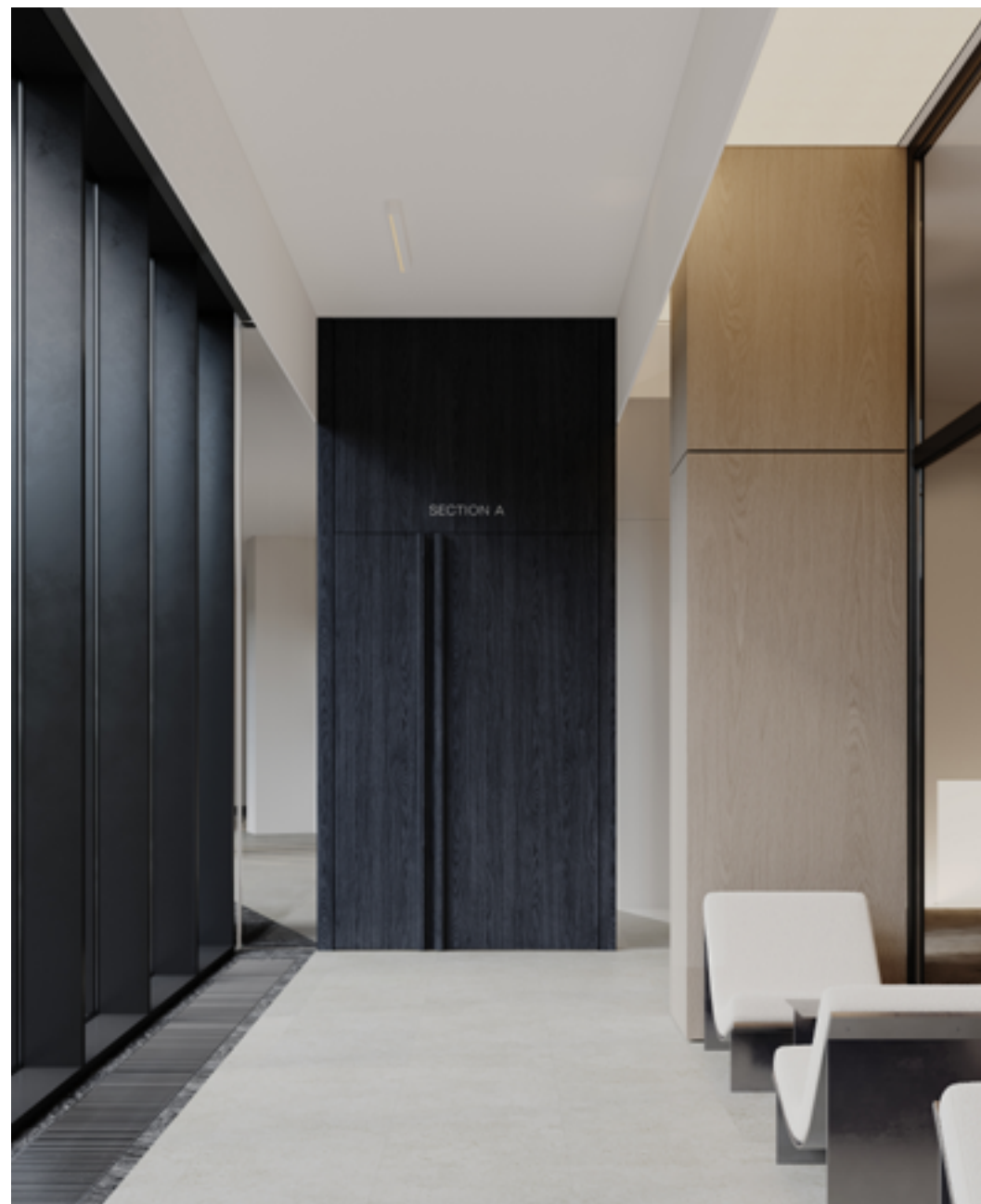
Светлая галерея с видами на внутренний двор