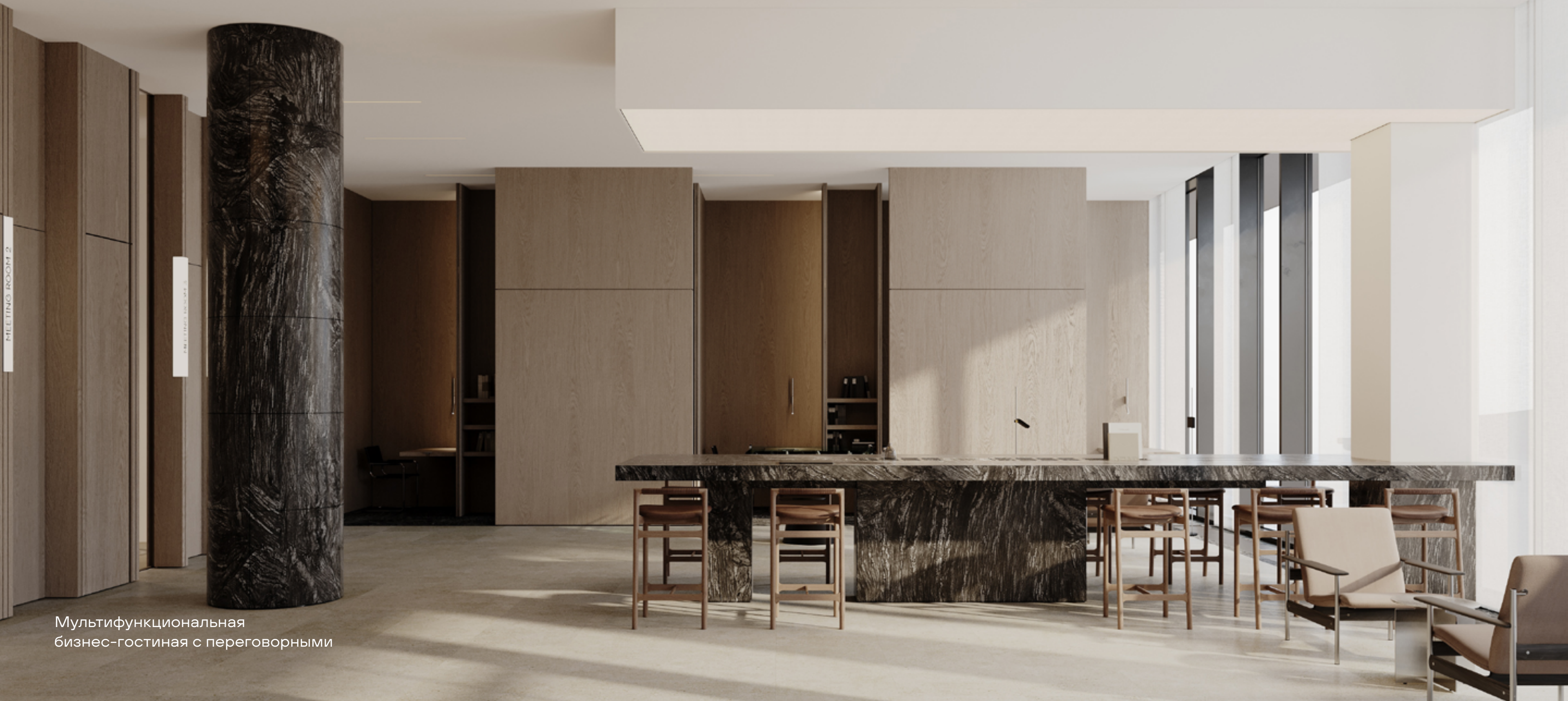
Мультифункциональная бизнес-гостиная с переговорными