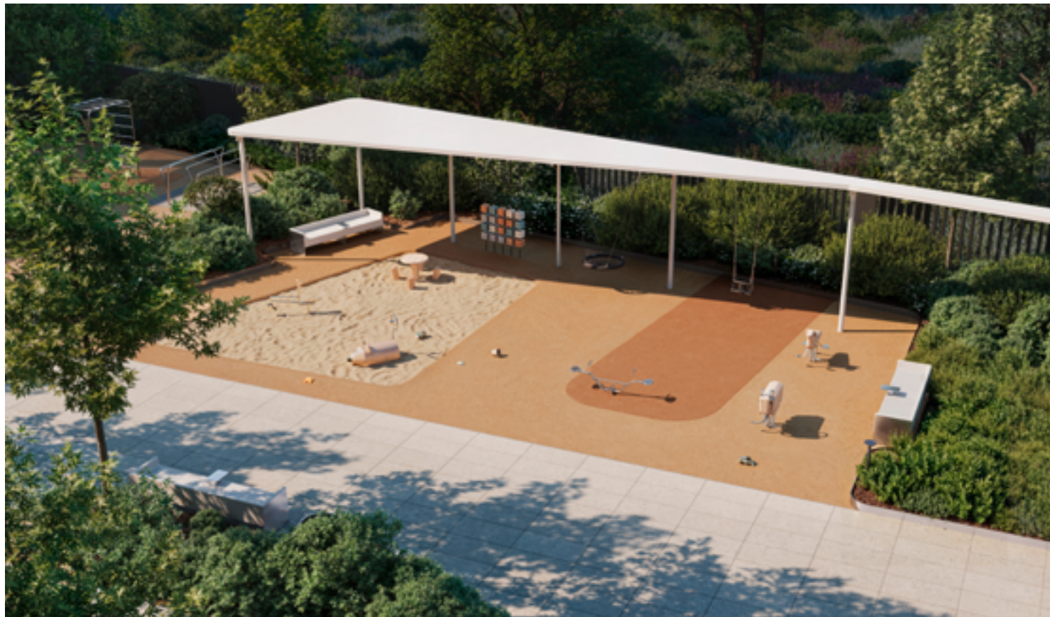
Площадка для самых маленьких с песочницей, тактильными досками и качелями под навесом