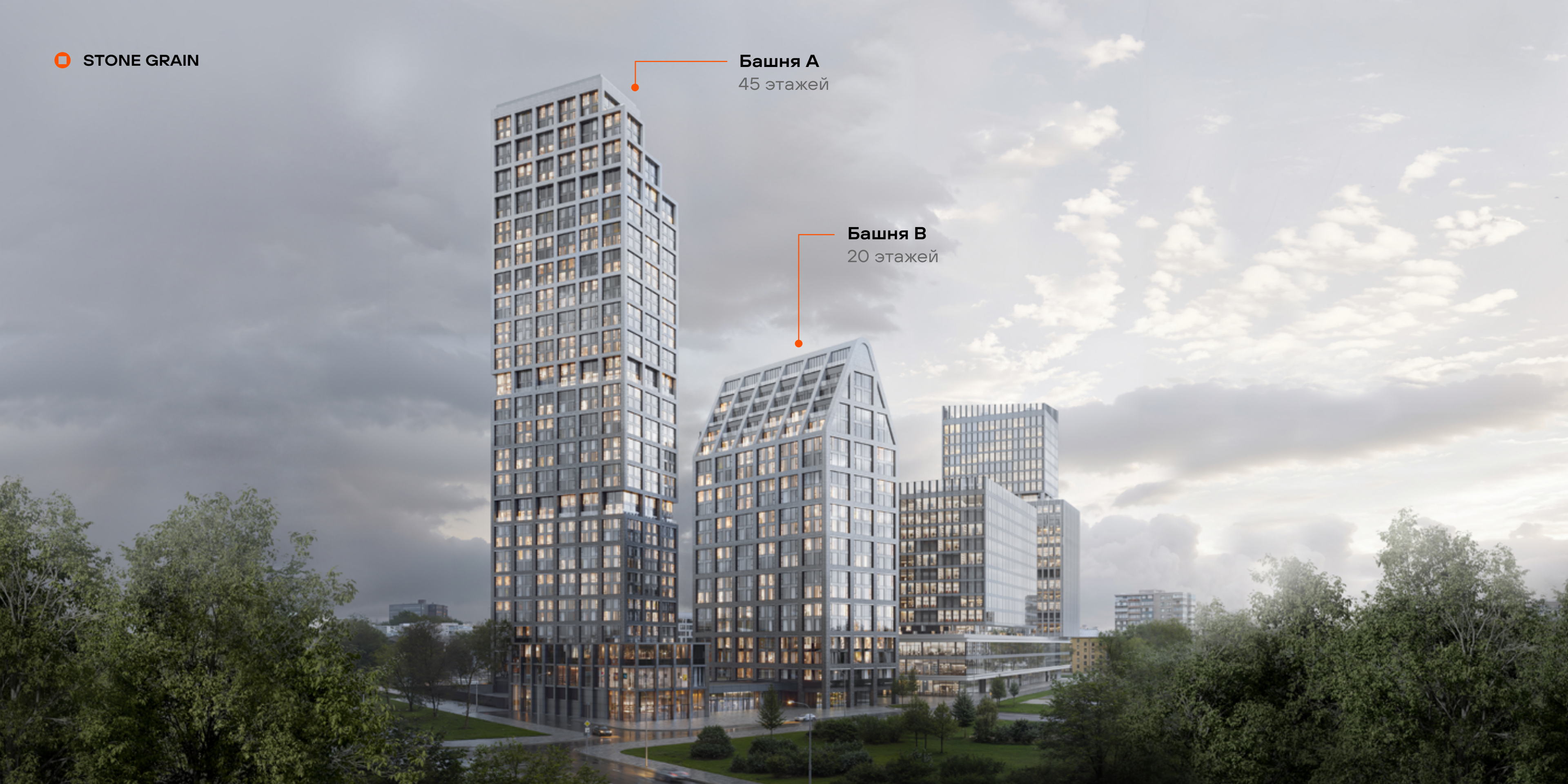
Башня В 20 этажей