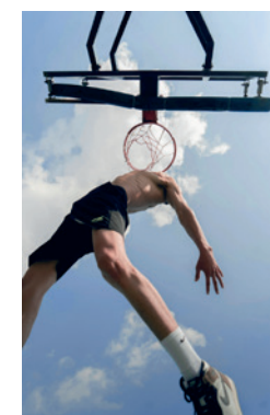
места для занятий спортом