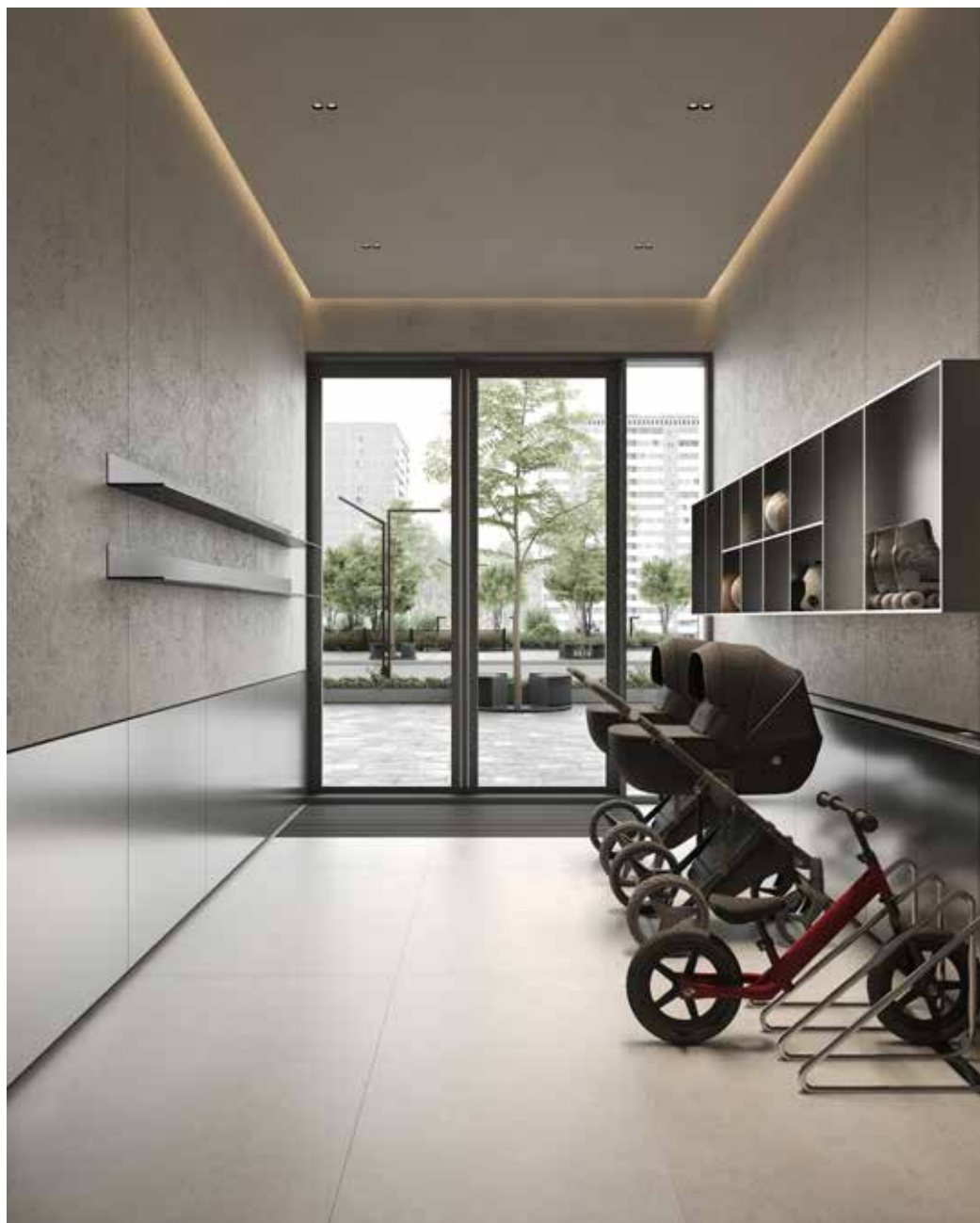
Колясочные на каждом этаже, а также в лобби