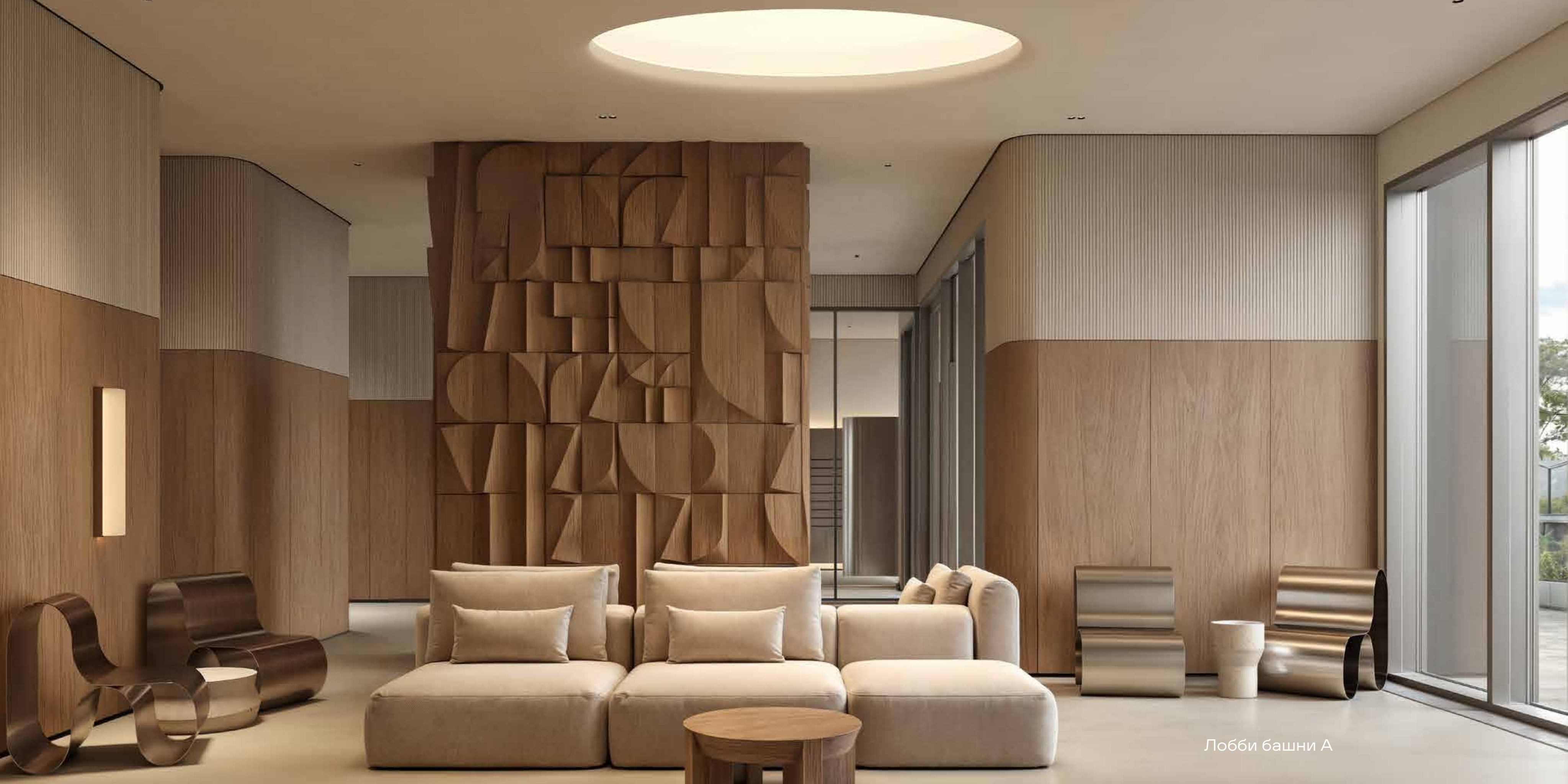
Лобби башни А