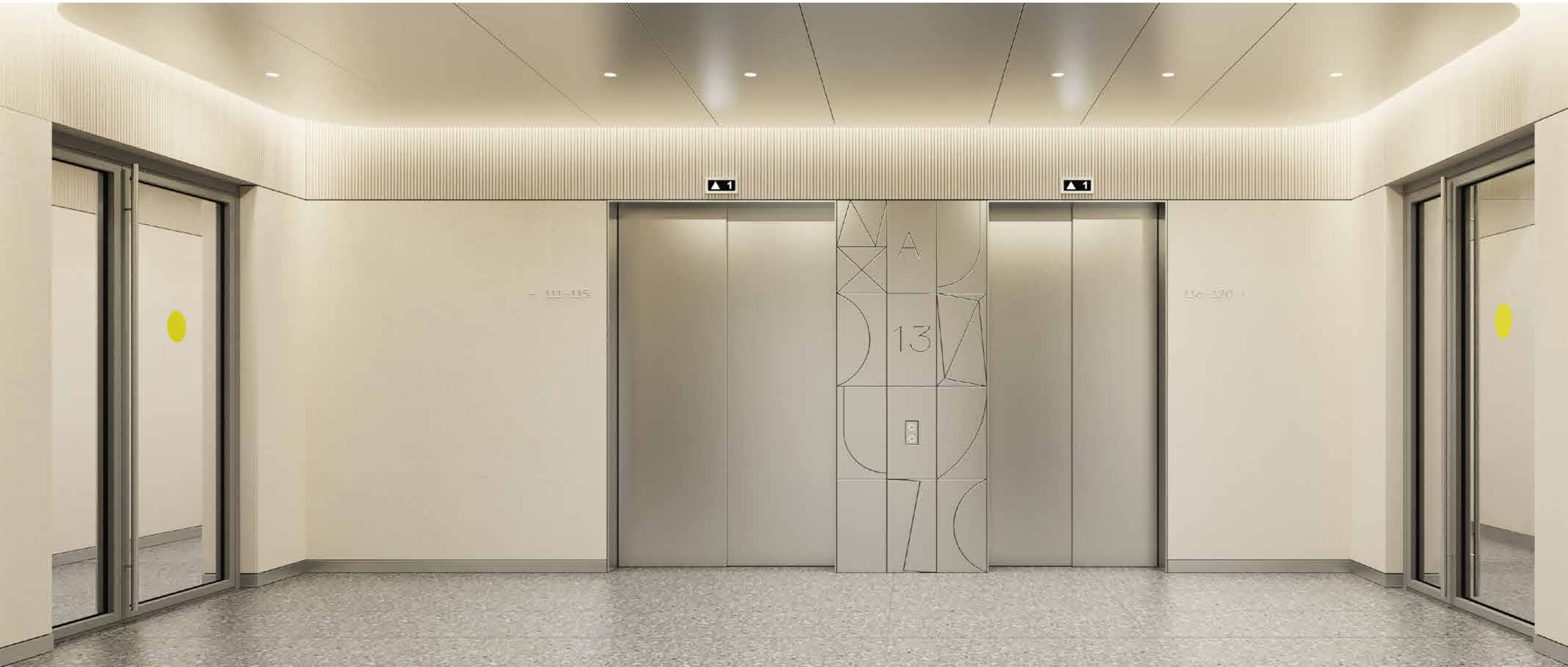
Лифтовой холл на этаже