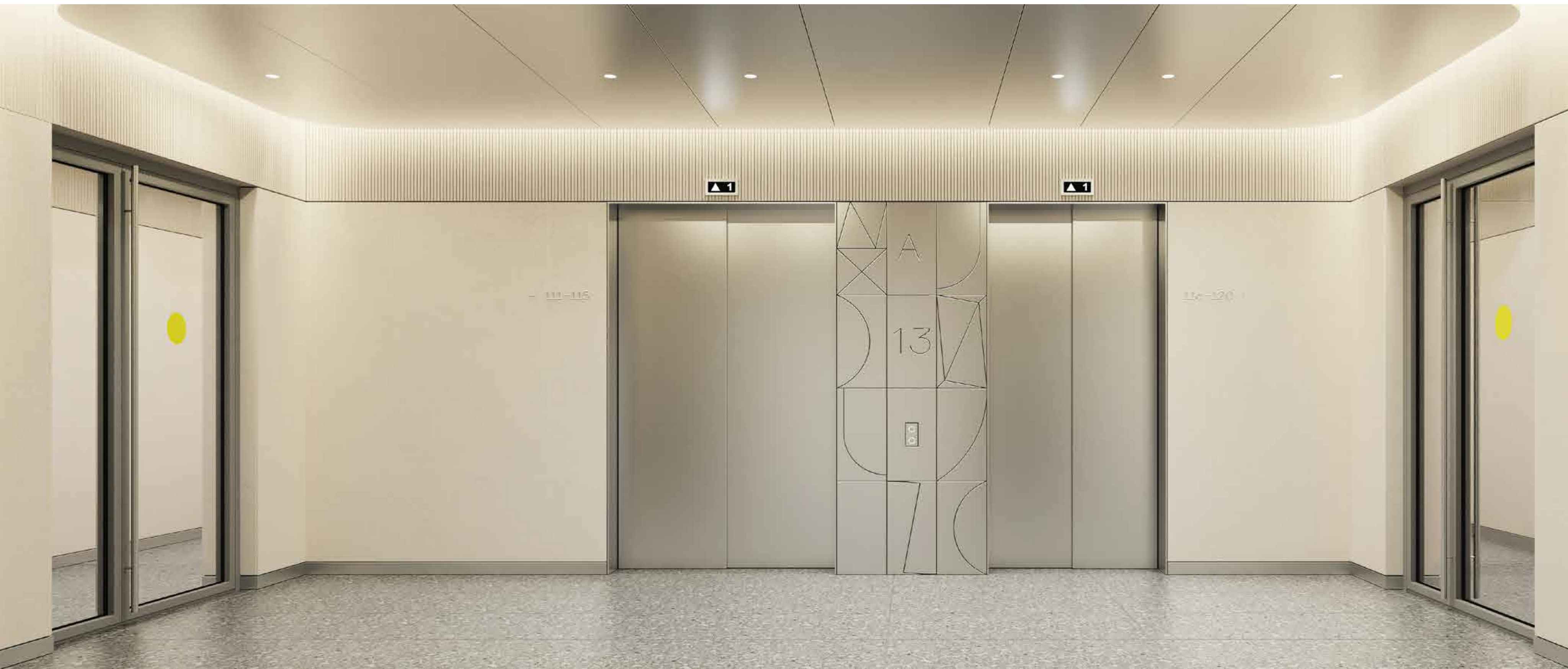
Лифтовой холл на этаже