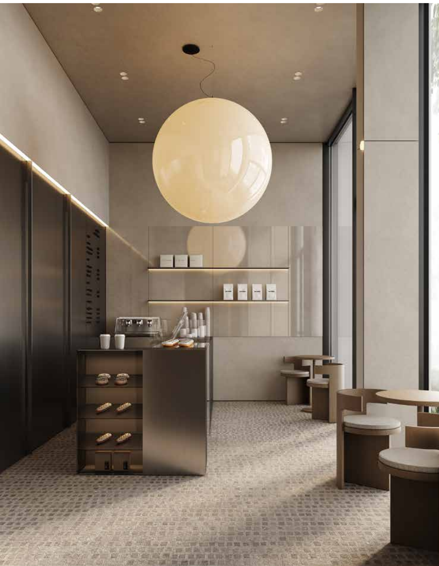
Кофейня в лобби