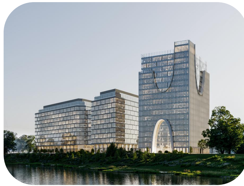
● STONE МНЁВНИКИ 1, 2