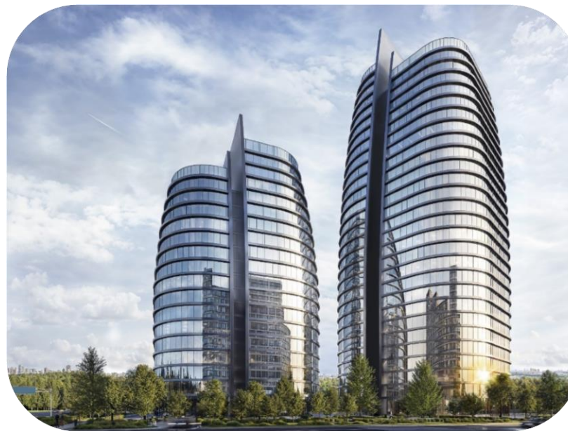
● STONE МНЁВНИКИ 3