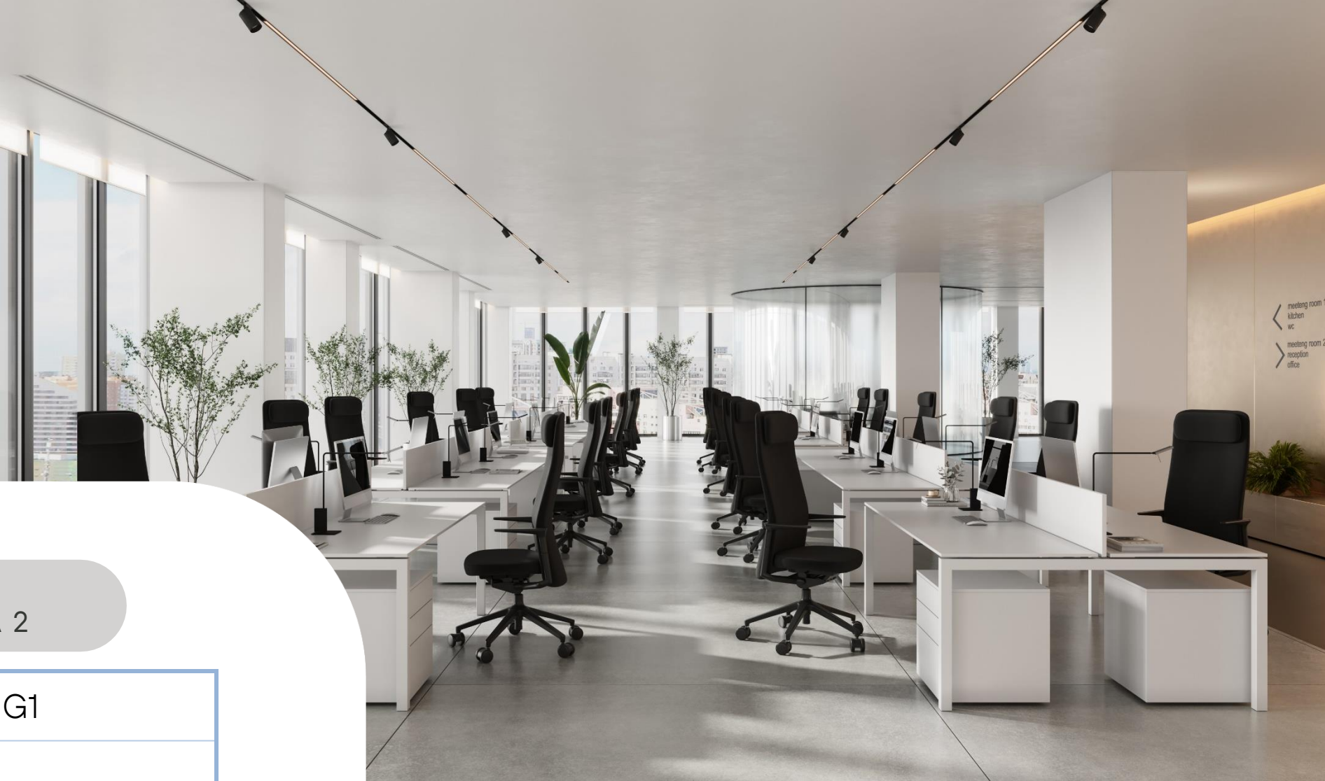
STONE ХОДЫНКА 1

Возможность приватно разместить крупную компанию на видовом этаже статусного бизнес-центра в премиальной офисной локации