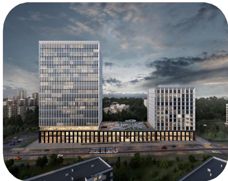
● STONE ЛЕНИНСКИЙ