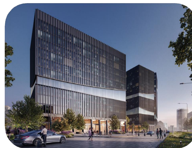
● STONE ХОДЫНКА 1